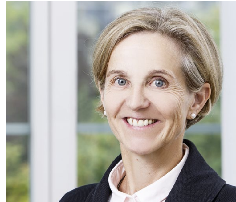
Merlin Photography Ltd., Mike Niederhauser

Das Eidgenössische Departement des Innern EDI hat die Krankenversicherungsbeiträge der Spitex per 1.1.2020 um 3,6% gesenkt. Auch wenn die Beiträge an die Heime erhöht wurden und so die Kantone beziehungsweise die Gemeinden nun insgesamt weniger Restkosten bezahlen müssen, war der Entscheid schwer nachvollziehbar und widerspricht dem Grundsatz «ambulant vor stationär». Laut der Spitex-Statistik des Bundesamtes für Statistik steigt nicht nur im Alterssegment der Bedarf nach Spitex-Leistungen stetig an. Auch bei den jüngeren Menschen steigt die Nachfrage: die Gründe sind frühere Spitalaustritte, die Zunahme ambulanter Operationen und gesellschaftliche Veränderungen im Zusammenleben. Insgesamt nimmt die Komplexität der Pflegefälle zu, da aufgrund der medizinischen Entwicklung komplexe Pflegesituationen zu Hause bewältigt werden können. Eine zunehmende Nachfrage bei Grundpflege, Spezial- sowie Nacht- und Wochenenddienstleistungen und das Zur-Verfügung-Stellen von genügend Ausbildungsplätzen führen nun mal zu mehr Ausgaben. Die Spitex-Organisationen werden weiterhin optimale qualitative Leistungen anbieten und alles daransetzen, ihre Betriebe unternehmerisch zu führen.